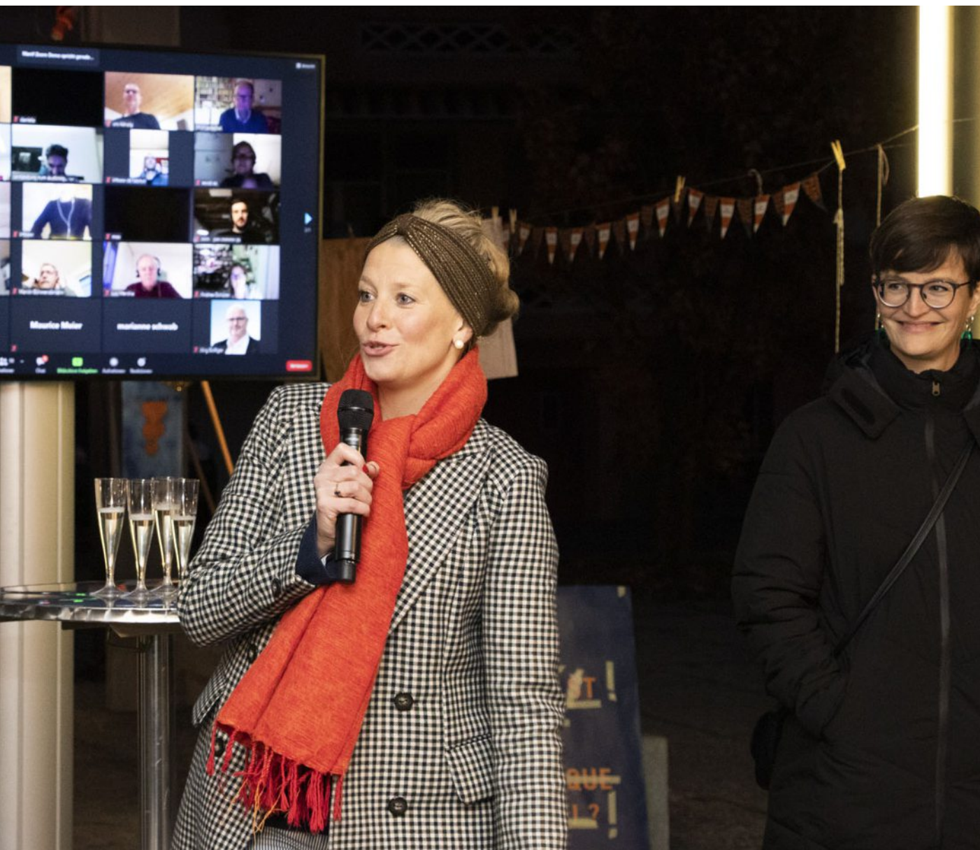
gestern die digitale Zusammenkunft der westastkritischen Bürgerbewegung «Biel wird laut». Sie hatte mit dem Widerstand gegen die gedreges Projekts beigetragen. LEE KNIPP

zahlreichen Sitzungen ist der Dialog gelungen und ein breit abgestützter