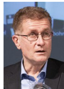
Christoph Neuhaus Bau- und Verkehrsdirektor Kanton Bern

Wir haben in der Stadt Biel noch immer 80 Prozent hausgemachten Verkehr und 20 Prozent Durchgangsverkehr. Und ganz wichtig: eine Lücke im nationalen Autobahnnetz, die geschlossen werden muss. Als Baudirektor des Kantons bin ich also nach wie vor überzeugt, dass man etwas tun muss. Gleichzeitig bin ich auch Realpolitiker und ich will nicht etwas bauen, was die Leute nicht wollen. Schliesslich werden wir nie herausfinden, ob das Ausführungsprojekt die